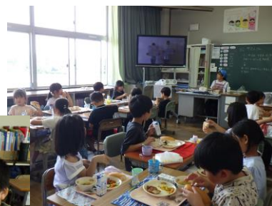
栃木県民の日の 放送の様子